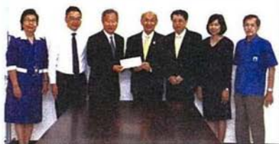
มอบเงินสนับสนุน 1 ล้านบาท แก่มูลนิธิยุวศิกิรคุณ