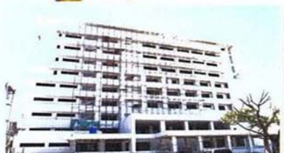
สนับสนุนการสร้างตึกโรคหัวใจเพื่อแผ่นดิน