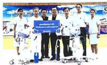
มอบเครื่องช่วยหายใจให้โรงพยาบาลทั่วประเทศ