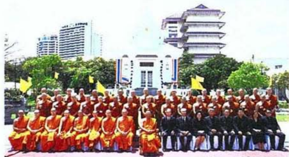
โครงการอุปสมบทหมู่ถวายเป็นพระราชกุศลฯ

สยามอินซัวร์ INSURANCE & FINANCIAL NEWSPAPER